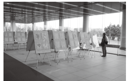
奈良県立図書館展示