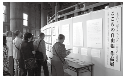
奈良・東大寺展示