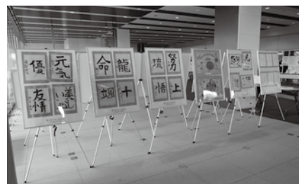
奈良県立図書情報館展示