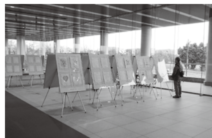
奈良県立図書館展示